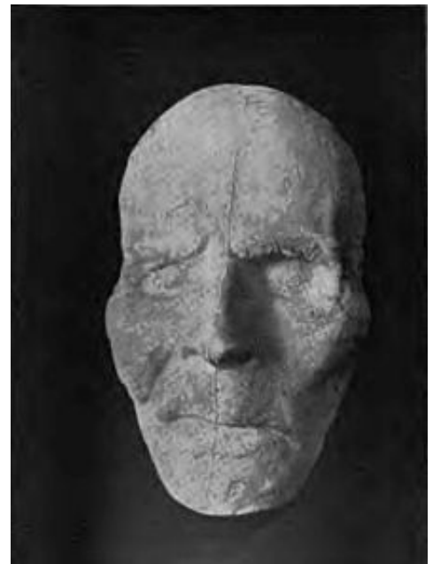
Death mask of Adam Weishaupt

"Weishaupt's plan was to educate Illuminati followers in the highest levels of humanity and morality (basing his teachings on the supremacy of Reason, allied with the spirit of the Golden Rule of not doing to others what one would not wish done to oneself), so that if Illuminati alumni subsequently attained positions of significance and power (such as in the fields of education and